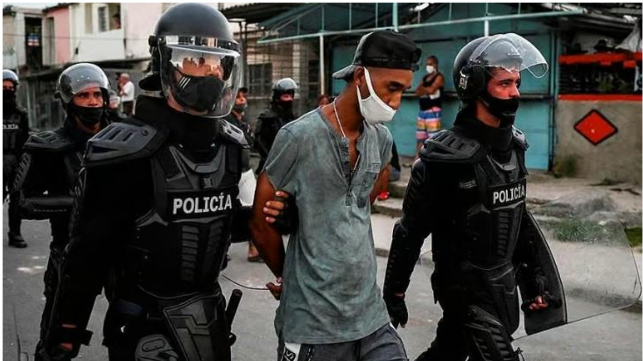
Arresto durante la protesta del 12-J en La Guinera.

La familia de Carlos Alberto observaba el movimiento de los antimotines desde el segundo piso de su casa, que quedaba casi llegando al triángulo, al final de la Avenida Güinera. Todos eran jóvenes veinteañeros, a los que se habían sumado algunos adolescentes que habían corrido a refugiarse allí. Filmaban lo que veían: las hileras de boinas negras con rifles que parecían de película, ocupando la avenida mientras dejaban un metro de distancia entre uno y otro. Filmaban los perros, también al odiado jefe de sector de la zona, apodado “El chiquitico”.