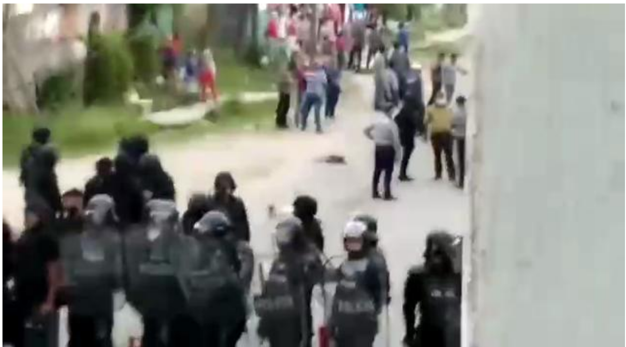
Despliegue de fuerzas represivas durante la protesta.

Esto, se pensará erróneamente, se debe solo a la impericia verbal de quienes escriben. Pero lo cierto es que el estilo nunca es falaz. Un misionero del lenguaje como George Orwell , diría que mienten solo por su estilo. Prueba de que sí tienen una inclinación verbal, sea o no consciente, fue la prohibición de una jueza a la costumbre de los testigos de La Güinera de referir los acontecimientos dividiendo los bandos en “la policía” y “el pueblo”. Errónea expresión, determinaría la jueza, porque “la policía es parte del pueblo”. También, curiosamente, los acusadores encontraron delatora la expresión de Odet Hernández y tantos otros para referirse a los funcionarios del Estado y demás representantes del Poder, como “los comunistas”. Encontraron despectivo, no descriptivo, este calificador nominalizado.