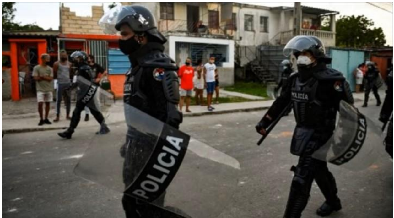
Tropas antimotines patrullan las calles de La Güinera.

Rodríguez Parrilla. En una conferencia de prensa llamada "Sobre la situación actual y la agresión incrementada del gobierno de los Estados Unidos", el ministro aclaró que "el 11 de julio hubo disturbios, hubo desórdenes, en una escala muy limitada", no un estallido social. Aún así, el comportamiento de esos cubanos desordenados no había sido idea de ellos: "Acuso al gobierno de Estados Unidos de estar implicado directamente y de tener grave responsabilidad en los incidentes que ocurrieron el 11 de julio".