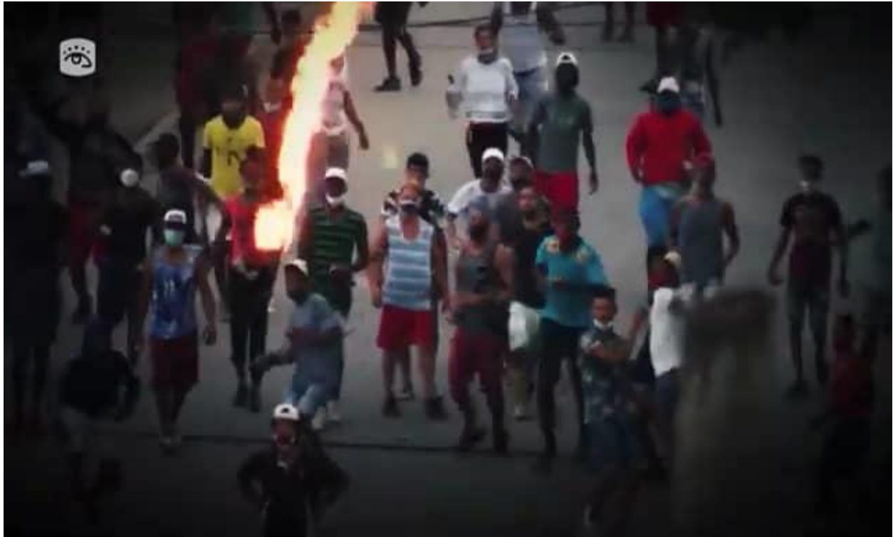
Manifestantes en La Güinera.

se comportan de manera extraña a la mayoría. No son más de diez, quizás, pero quieren controlarlo todo. Llevan camisas y pantalones pasados de moda, con bolsillos aptos para lápices y carnets. “No nos quieren dejar pasar pa’llá porque ahí está la estación de policía”, dice Odet a la cámara. “Vamos”.